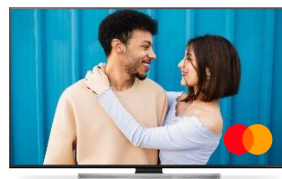
X2 Copies VOSTFR