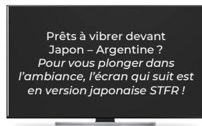
Transition présentant la démarche