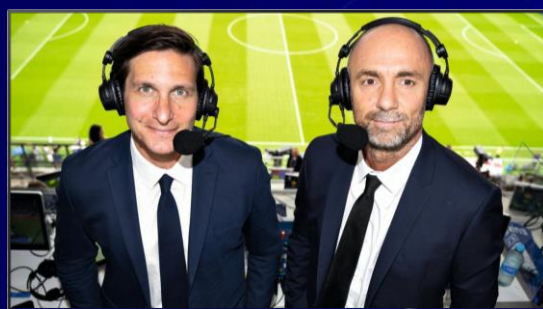
Direct – aucune mention marque