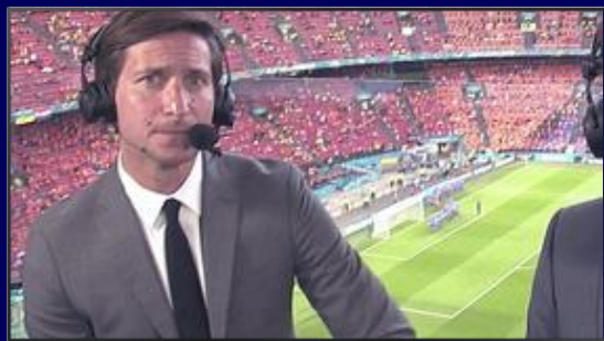
Spot 20" en amont Teasing marque/produit