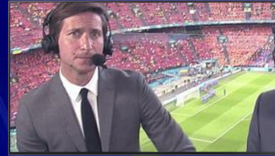
Spot 20" mi-temps Commentateurs pris sur le fait

*Sous réserve de validation de la direction des programmes, du juridique et des personnalités