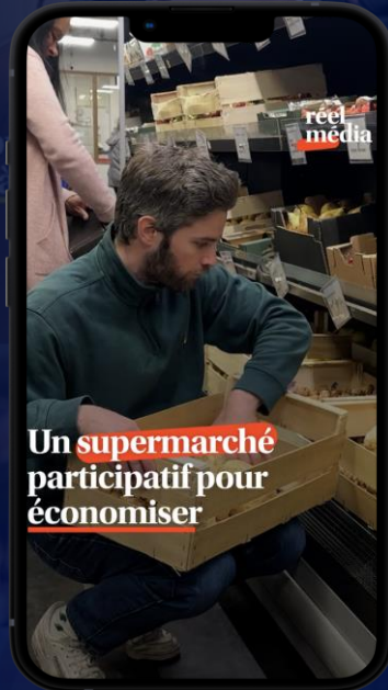
La Louve, un supermarché coopératif et participatif 2,7 M de vues