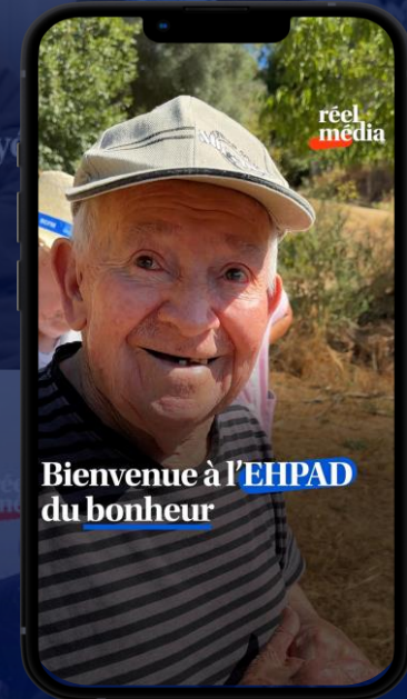
L'EHPAD Jeanne d'Arc innove et réinvente la vie des résidents 1,1 M de vues