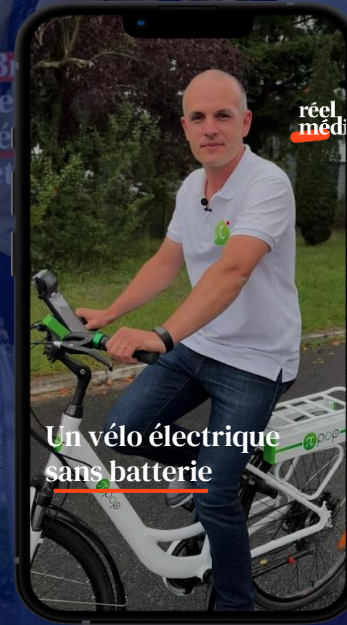
Un vélo électrique qui fonctionne sans batterie créé par l'entreprise STEE 2,4 M de vues