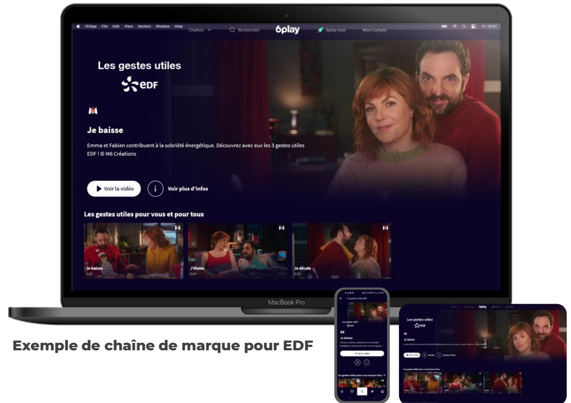
Exemple de chaîne de marque pour EDF

Dispositif de promotion éditoriale (gracieux) pour renvoyer vers votre espace. Ex : mises en avant en HP, zone à découvrir, jingle, totem ... et publications en sociales