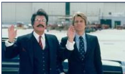
© Stephen J. Cannell Productions. All Rights Reserved.